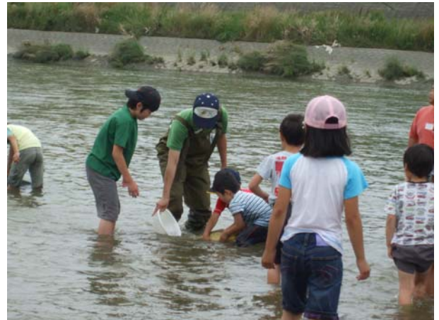
大和川で活動する子どもたち (2011年6月・・・浅香・水辺の楽校エリアで)

窒素酸化物(NO x )は紫外線により光化学反応を起し、気管支炎などの健康被害や、農作物などに影響を与えます。